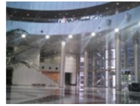
商業施設・ホール